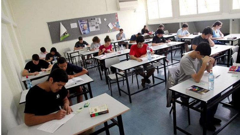
בפני המורה בתיכון ניצבות 40 פרסונות שונות, שכל אחת מהן זקוקה למודל הוראה אחר

מערכות ללמידה מרחוק הן אחד מאותם שירותים, אשר לא רק שמשפרות את איכות החיים של התלמיד, אלא שתורמות לפתרון בעיה אקוטית שהעולם כולו מתמודד עמה: פערי רמה ניכרים באיכות ההוראה בין המרכזים העירוניים והישובים המבוססים לבין הפריפריה הגיאוגרפית או החברתית (השכונות החלשות בערי המרכז).